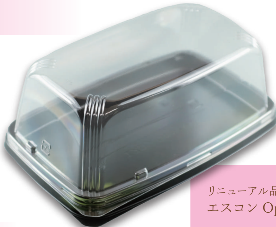
リニューアル品 エスコン Operaシリーズ