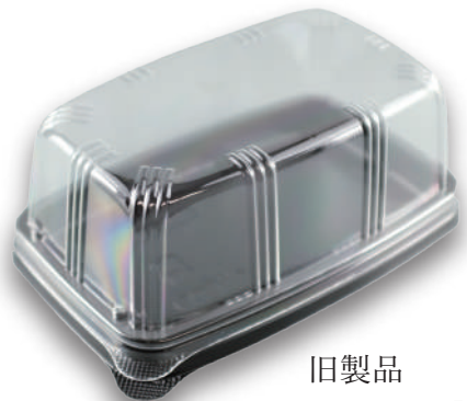
旧製品 エスコン L-50 シリーズ