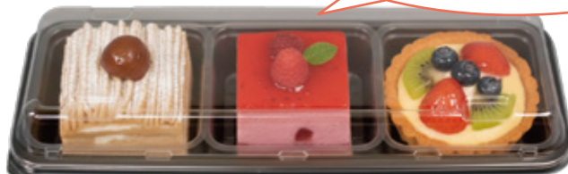
※イメージ画像です