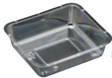
折 200 中仕切 -2