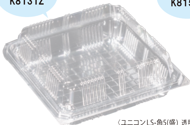
〈ユニコンLS-角5(盛)_透明〉