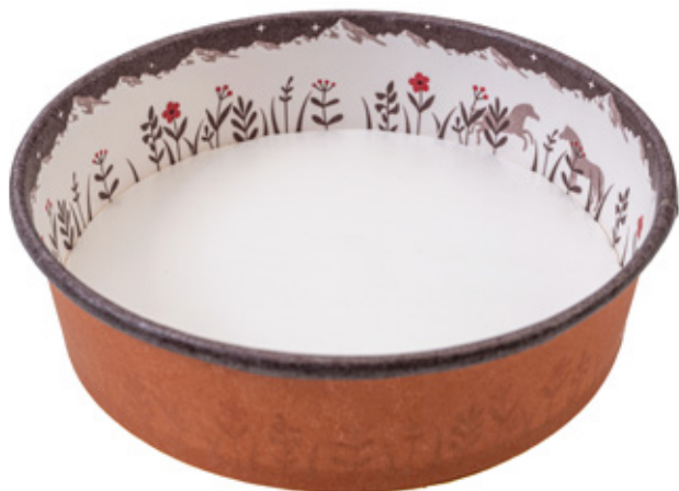
K8131Y / K8151Y 〈色柄:山ブラウン/オレンジ〉