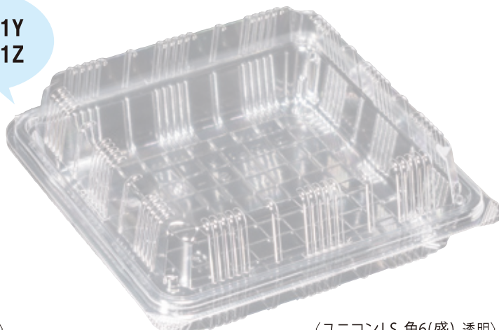
〈ユニコンLS-角6(盛)_透明〉