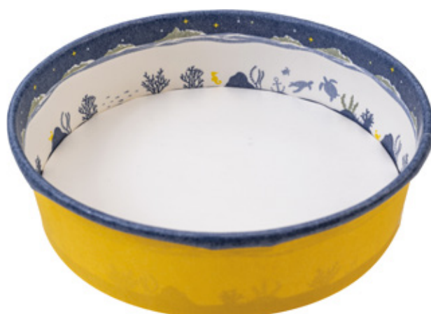
K8131Z / K8151Z 〈色柄:海ネイビー/イエロー〉